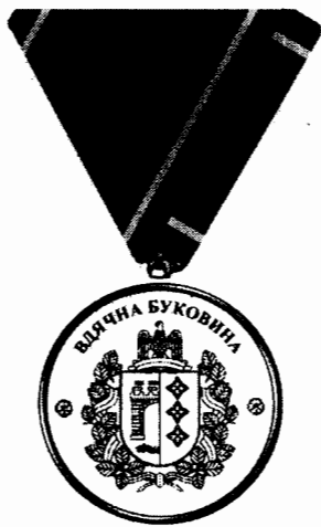
Зображення 1 відзнаки «Вдячна Буковина» (аверс)

Додаток до Опису Почесної відзнаки Чернівецької обласної державної адміністрації та Чернівецької обласної ради «Вдячна Буковина» (пункт 3)