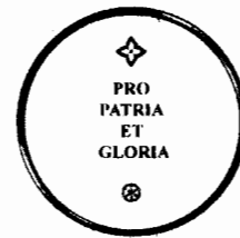
Зображення 2 відзнаки «Вдячна Буковина» (реверс)